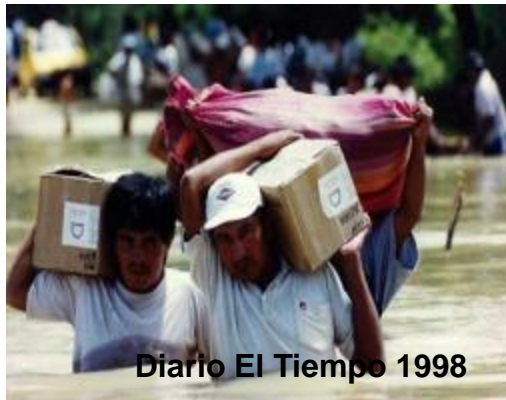
Diario El Tiempo 1998

Este fenómeno también está asociado a las lluvias, pero en este caso se trata de lluvias torrenciales que provocan fuertes inundaciones y que pueden no solamente dañar los cultivos sino que dañan viviendas, tierras de cultivo, vías de comunicación y hasta pérdidas humanas, siendo considerado un desastre de proporciones significativas.